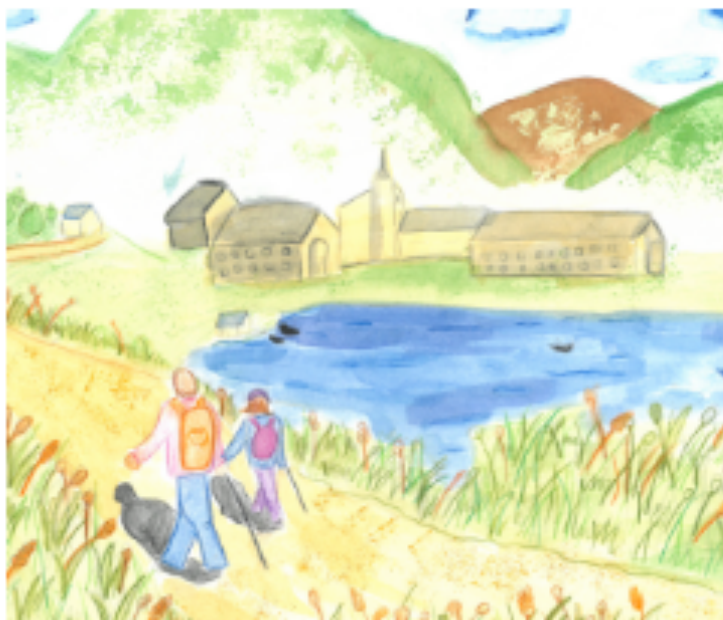
Tona Borbonet i Álvarez

Amics de Núria podrà penjar a la web les fotografies i relats. Al Santuari s'ex- posaran les obres dels participants.