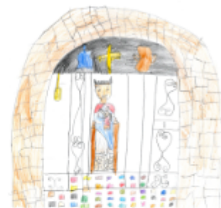
Elena Argelich Vila