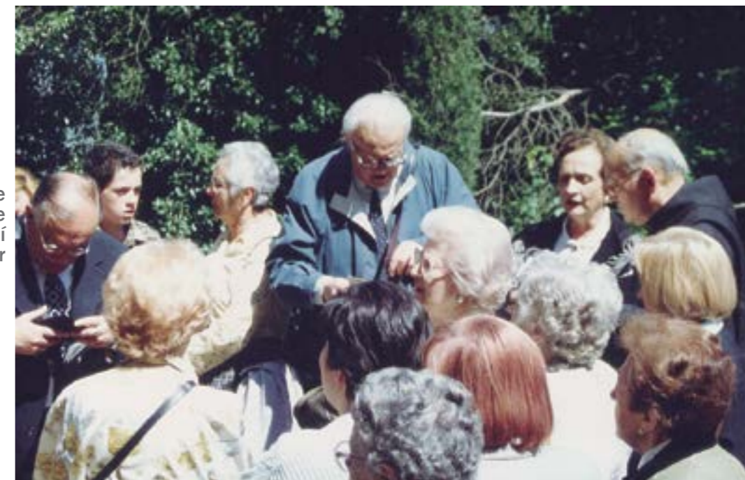
Durant la inauguració de la majòlica de la Mare de Déu de Núrria al Camí dels Degotalls, el gener de 1994