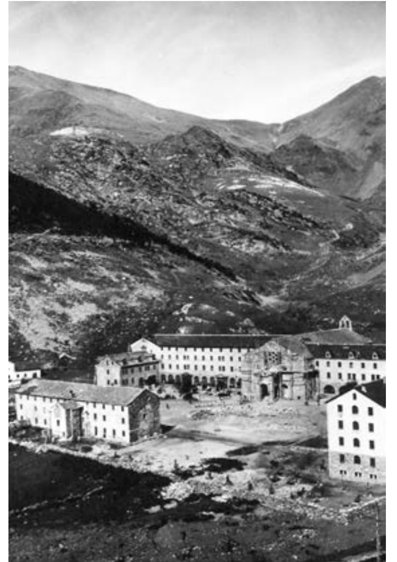
La plana del santuari l'any 1952. A primer terme a l'esquerra el desaparegut edifici que allotjava els caputxins i els escolans.

Sempre recordaré aquest primer dia a Núria. Em va impactar la quantitat de persones que venien a esperar els cremalleres, i també com l'estació s'omplia de gent, a la tarda, quan retornàvem a Ribes de Freser, i com aquella gent i aquell paisatge s'allunyaven lentament dels nostres ulls fins a perdre's entre túnels i gorgs. I aleshores, com cada estiu, començava l'enyorament que perdurava, any rere any, fins al moment en què hi podíem tornar.