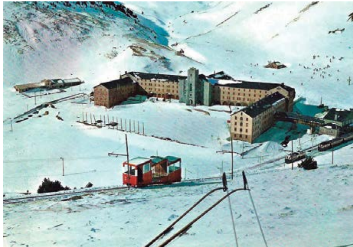
Antic funicular de Núria

Gràcies per haver-me llegit fins aquí. Una abraçada ben forta a tots i a cadascun de vosaltres. ♦