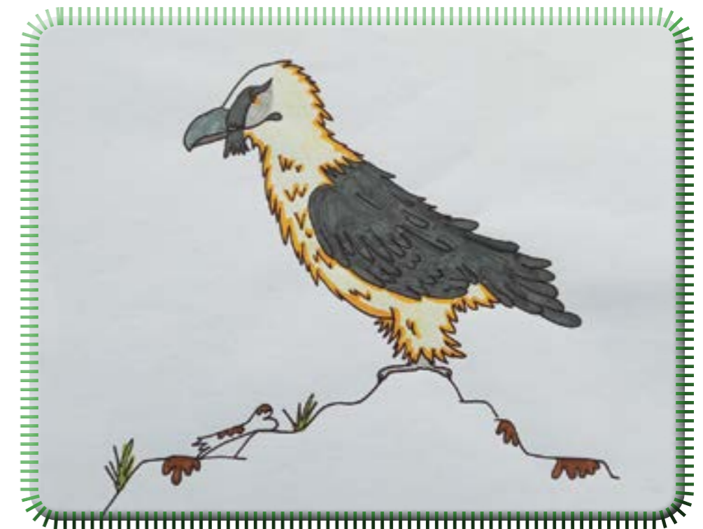
Trencalòs ( Gypaetus barbatus )

Els primers habitants de Núria varen ser un seguit d'espècies animals, algunes ja desaparegudes, altres encara entre nosaltres, que val la pena de conèixer, perquè sense la seva companyia i presència sant Gil no hauria pogut resistir la solitud d'aquest lloc abans de la fundació del santuari. Sabem que sant Gil, un gran amant de la solitud i de la muntanya, estimava i protegia els animals que hi trobava. El coneixement d'aquest aspecte de la vida nurienca ha de servir per a refermar i actualitzar uns valors ben necessaris.