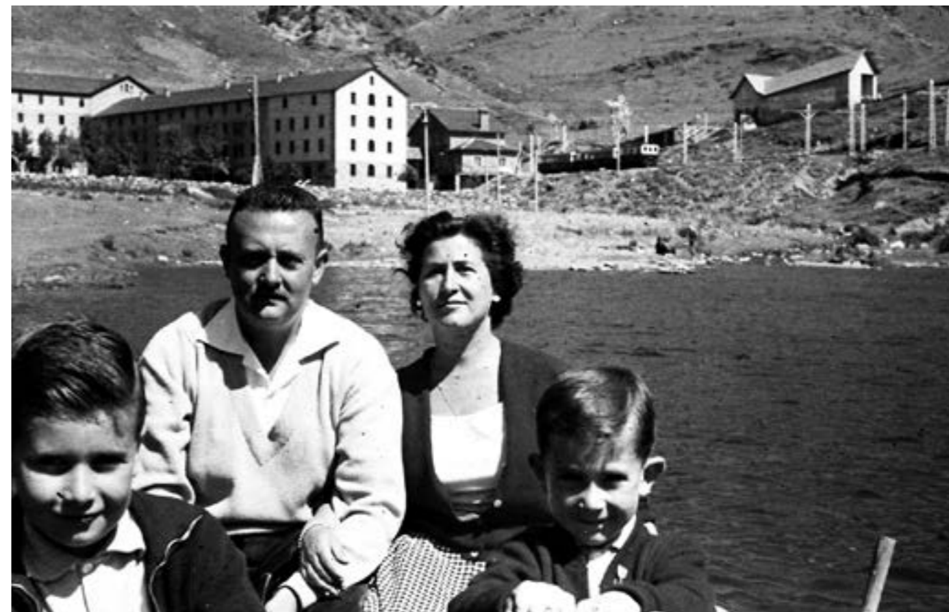
Al llac amb la seva esposa i fills; 1 d'agost del 1960

Va impulsar les sortides culturals dels associats, un nou format de butlletí informatiu i, juntament amb les autoritats de Queralbs, va promoure l'any 1991 la recu-