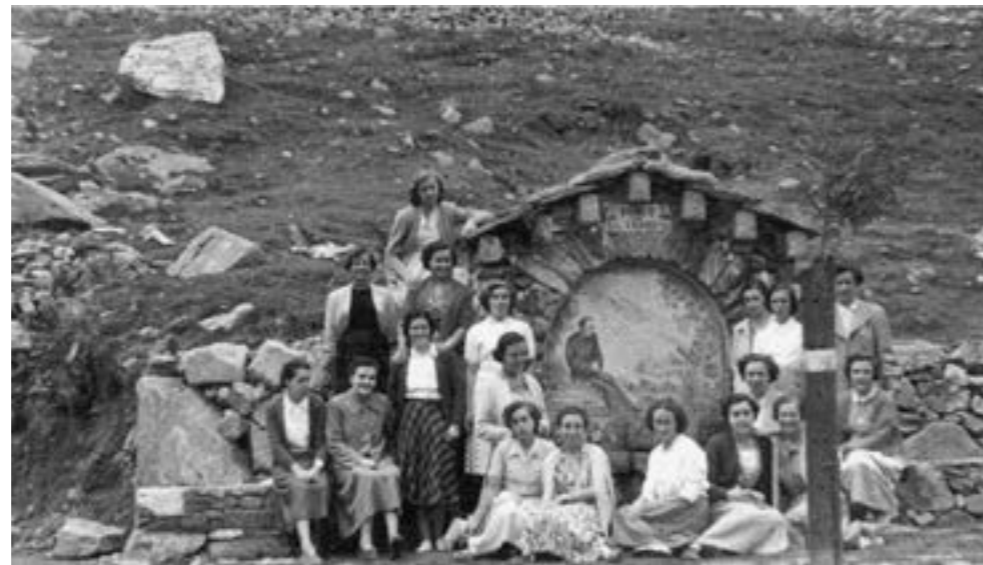
Noies d'Acció Catòlica davant de la font del doctor Tarrés a Núria. Any 1952. Col·lecció de Magda Planelles

Aquest encontre amb Núria el dec a les persones d'Acció Catòlica de Sarrià que, a l'estiu, organitzaven estades a Núria per a noies del barri. Del 17 al 27 d'agost hi anaven les noies del casal de les «obres», que era el grup més nombrós, i del 27 d'agost al 9 de setembre, la resta de noies, fonamentalment de Sarrià. En general l'edat d'aquestes noies anava dels 18 anys en