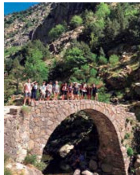
Foto de grup al damunt del Pont de Cremal