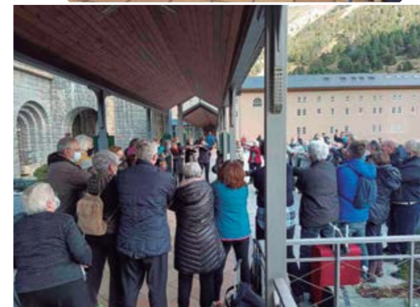
«És l'hora dels adeus i ens hem de dir adéu-siau»

Amb una marmota que treu el cap entre boscos i rocs, i que diu «Vine i descobreix en quin paratge estem» els Pessebristes de Teià convidaven tothom a visitar el monumental pessebre de catorze metres quadrats, que ha esdevingut una tradició viva de dotze anys al poble de Teià.