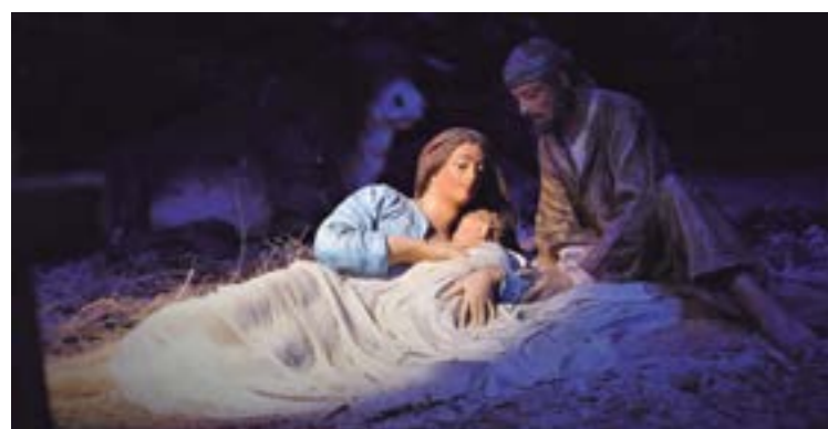
Detall del Naixement: la Mare de Déu amb l'Infant Jesús