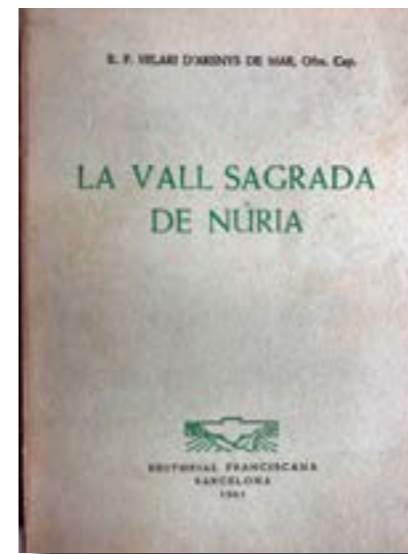
Portada del llibre comentat

de nosaltres», li diu, o «sabem que ha baixat a Barcelona i no ens ha vingut a veure», etcètera. S'hi veu la força d'un home acostumat a fer passar la seva. Igual que quan s'asseia a taula esperava que la meva àvia li posés aigua de Vichy, encara que tingués l'ampolla a tocar; quan feia de mecenes confiava que la gent respongués amb la mateixa força i diligència que ell posava en els seus amors, sovint relacionats amb l'art i l'Església. Entre moltes altres coses va finançar, per exemple, un dels àngels de la façana del naixement de la Sagrada Família.