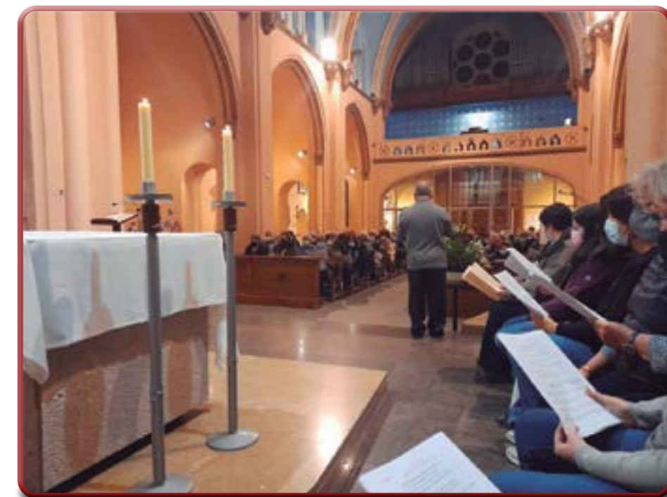
Un moment de la missa, on el cant hi va tenir un paper important

La trobada a Núria és una de les Trobades Generals de tardor, que es van iniciar l'any 1971 i que, des de 1984, es fan amb continuïtat. Resseguint la geografia catalana, els animadors de cant es van aplegant en diferents indrets per tal de participar en les seves realitats parroquials. ♦