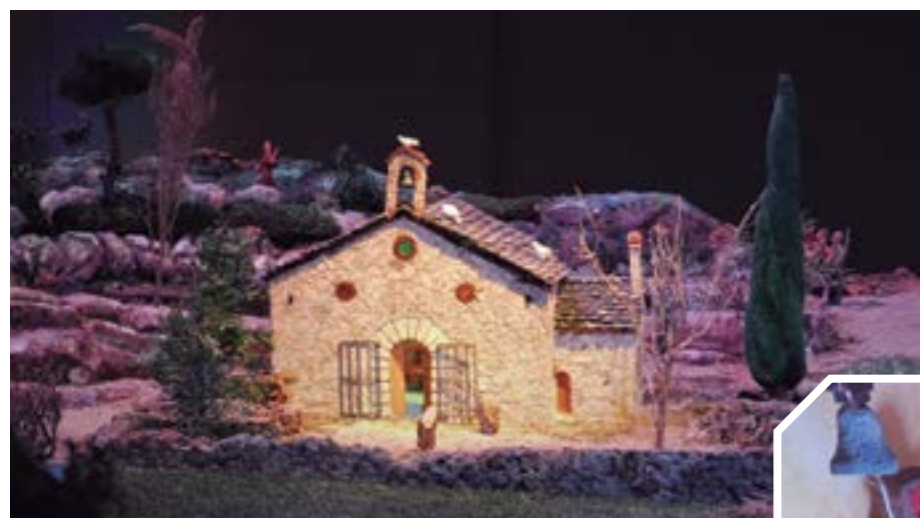
L'Ermita de Sant Gil