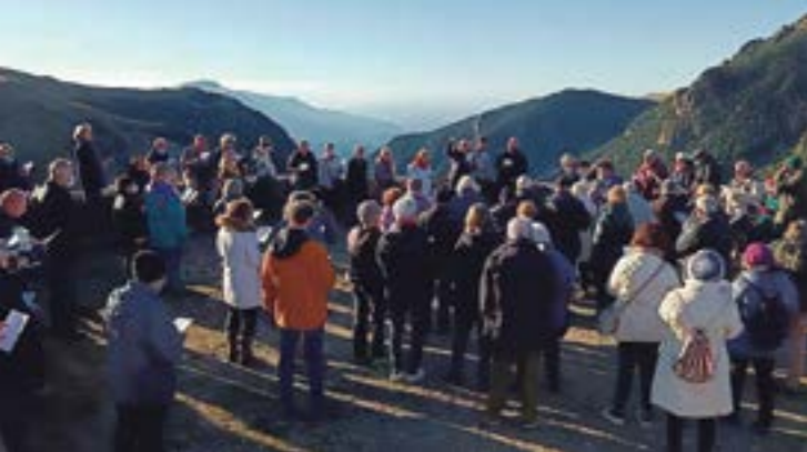
Cantant davant la immensa creació de Déu, al mirador de l'Alberg Pic de l'Àliga