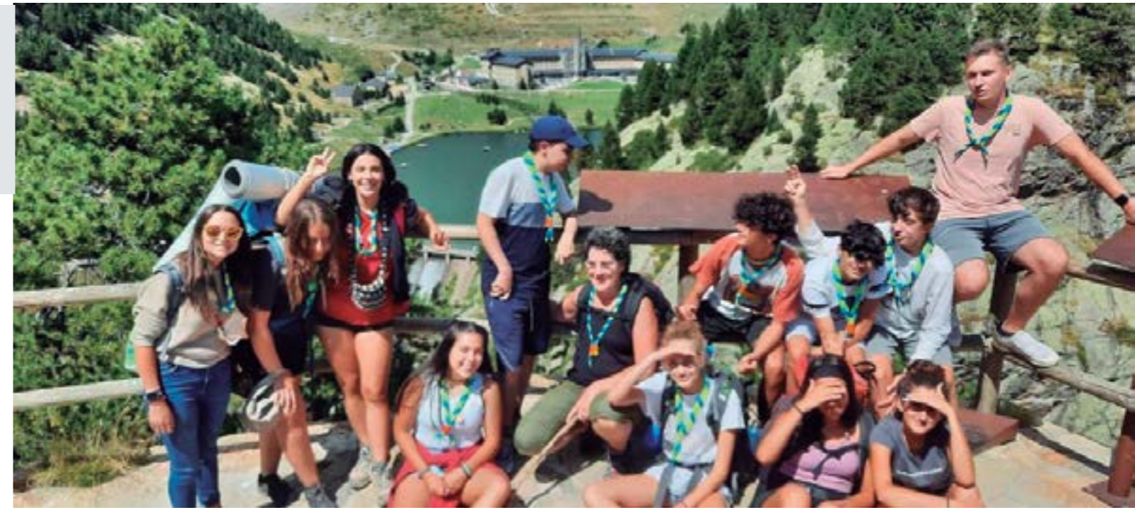
Panorama clàssic des del Mirador de la Creu d'en Riba

Donem gràcies per aquests dies, i encoratgem i animem altres peregrins a fer aquest Camí cap al santuari de Núria. ♦