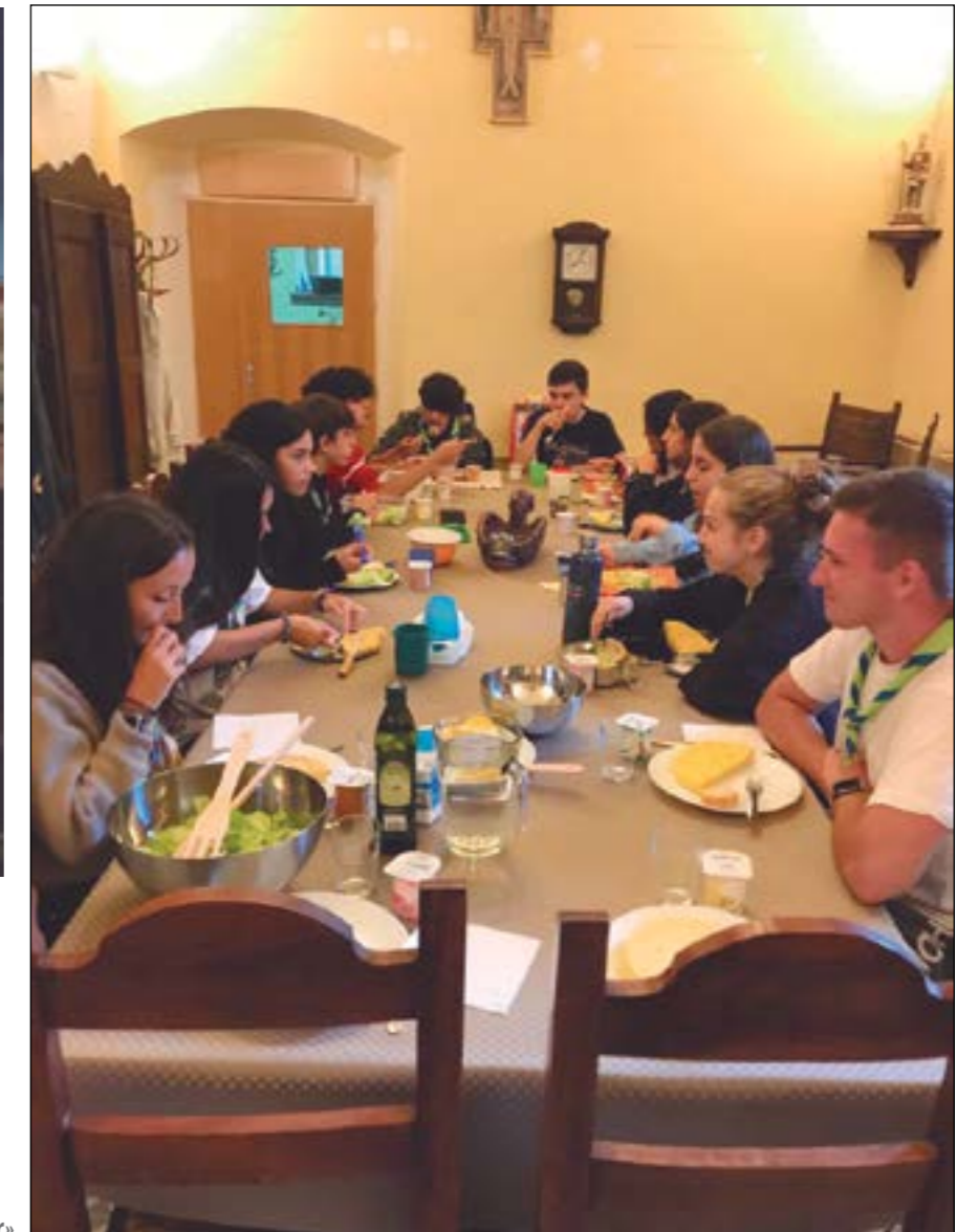
Tots els àpats van ser «de germanor»