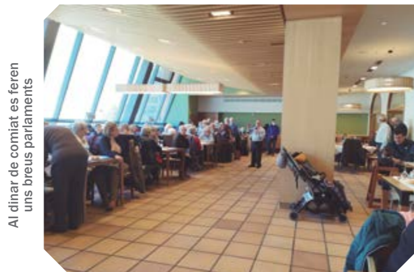
Al dinar de comiat es feren uns breus parlaments