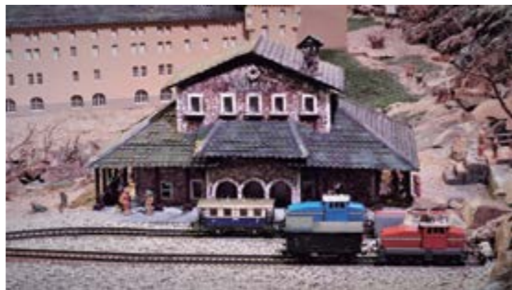
Simpàtica reproducció de l'estació del cremallera