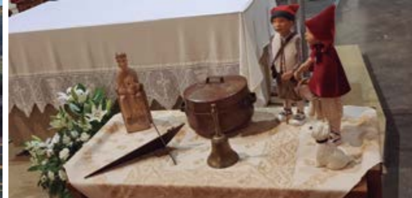
A la vetlla de pregària es revisqué la tradició de sant Gil