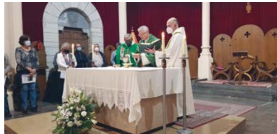
Un moment de la concelebració