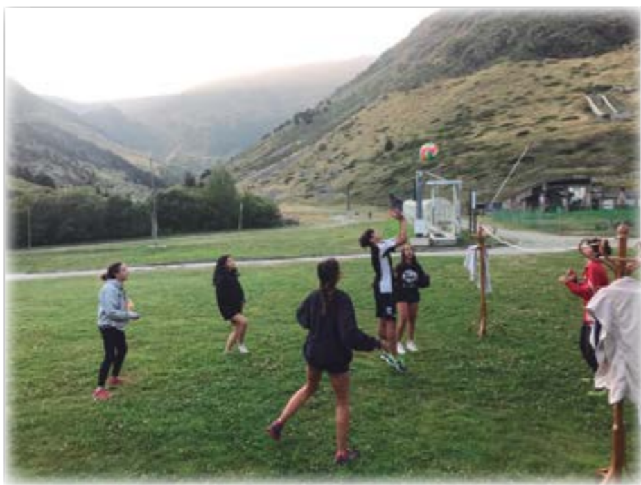
Un improvisat camp de voleibol