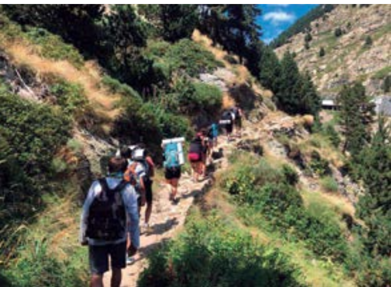
Enfilant-se pel tradicional camí de Núria