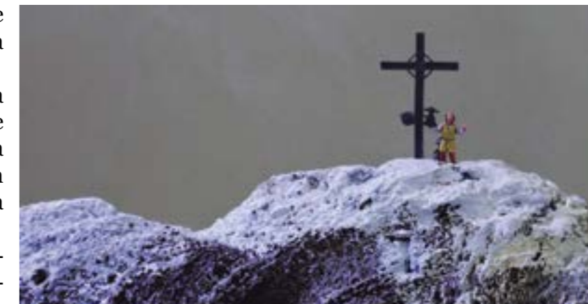
Cim del Puigmal