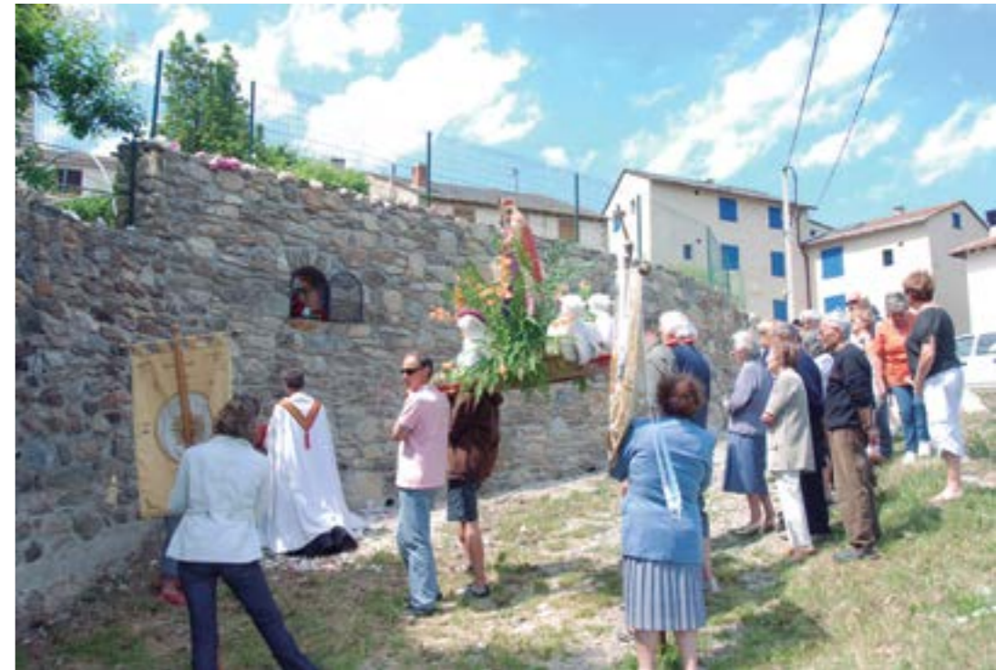
Festa de Sant Eloi, al camí de Besiers dels Angles (any 2012)

Avui, la família ha dedicat un oratori a la Verge a dalt del camí de Besiers en recordança a l'aplegador, que és una estació durant la processó que es fa cada any el dia 25 de juny, dia de sant Eloi, patró dels ramats de vaques.