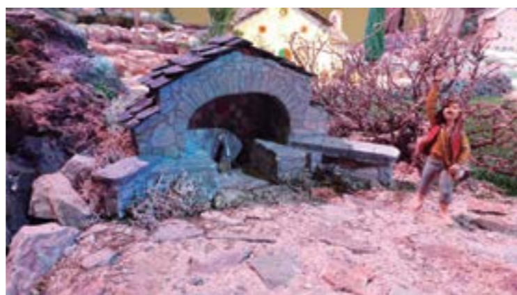
La Font de Sant Gil