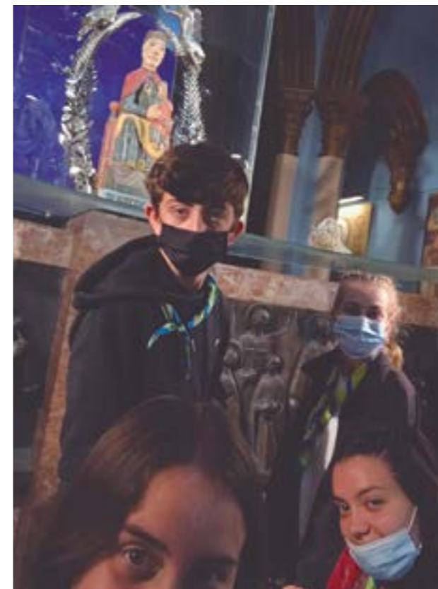
Com diuen els Goigs, «nem-la tots a visitar»