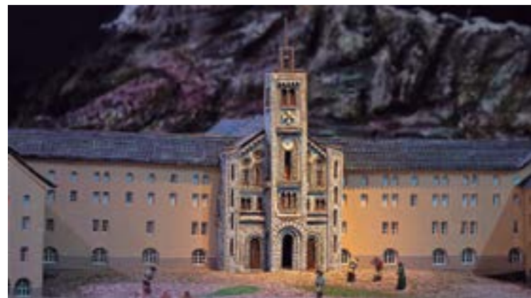
Façana de la Basílica i edificis adjacents