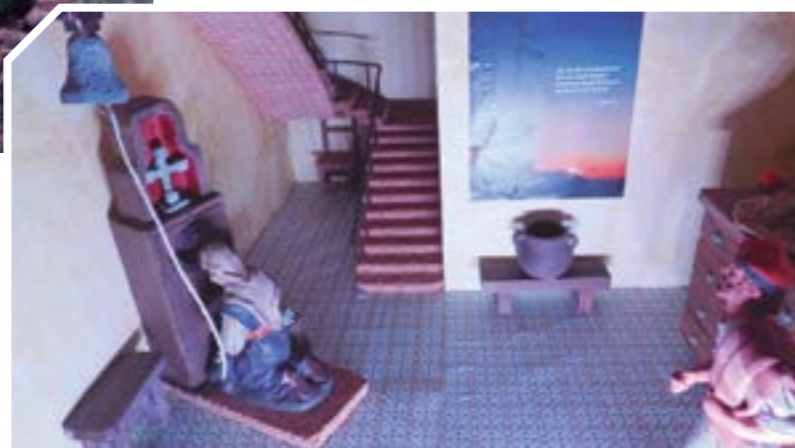
Una pelegrina prega davant la Creu ficant el cap a l'Olla i tocant la Campana