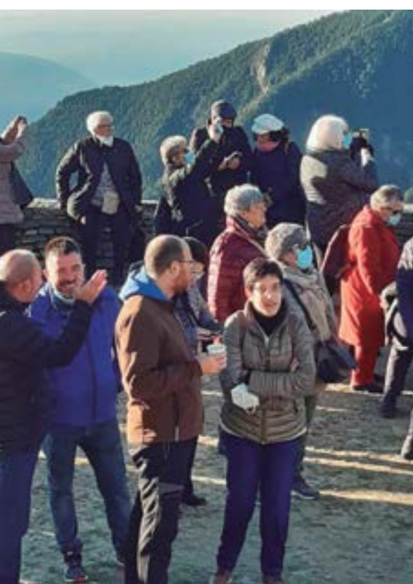
Admirant el Pirineu