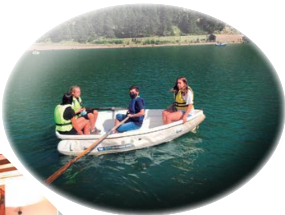
Un refrescant passeig amb barca