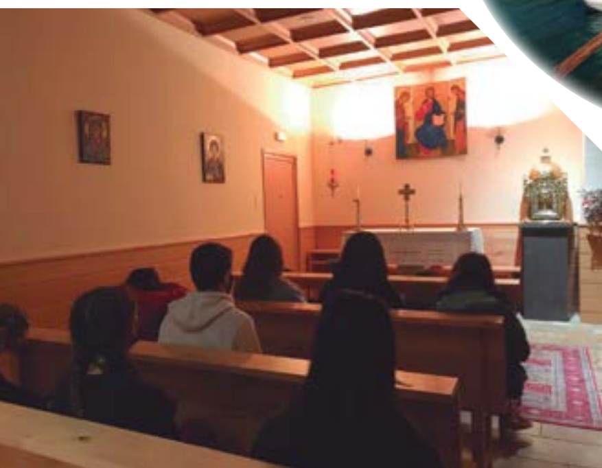
A la Capella Fonda del Santuari