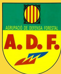
Agrupació de defensa forestal