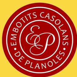
Embotits Casolans de Planoles

DES D'AQUÍ DONEM LES GRACIES A TOTS ELS SPONSORS I COL-LABORADORS QUE FAN POSSIBLE AQUEST PELEGRINATGE